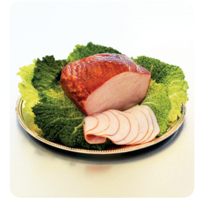
Rökt kalkonbröst ca 700 g