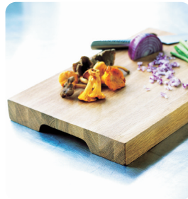
Skärbräda av ek