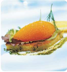
Sikrom ca 160 g