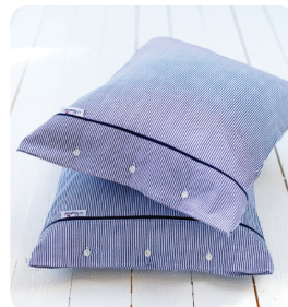
Riverhead Bädset 2 delar