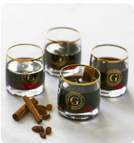
Garrett vattenglas 4-pack