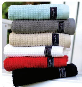
Newport Frotté 2 st