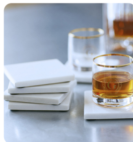
Underlägg marmor 6 st