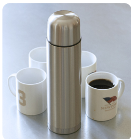
Aluminium termos 1,1 L