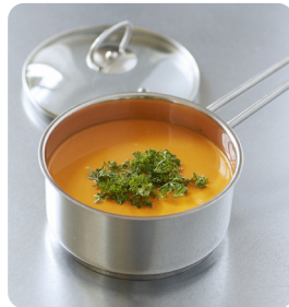
Kastrull med glaslock 1,5 L