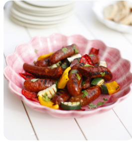
Lammkorv ca 500 g