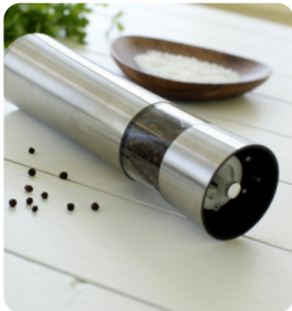
Peppermill 1 st