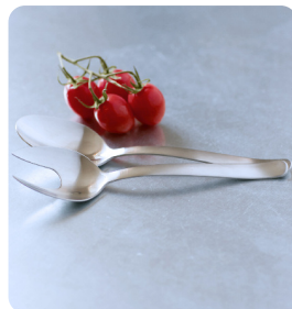
Salladsbestick 1 par