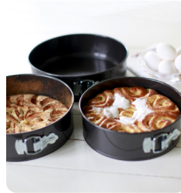
Bakformar 3 st