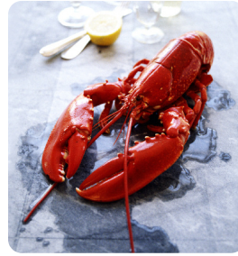
Hummer 1 st ca 350 g