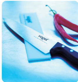
Kockkniv 20 cm