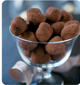
Tryffel 2 x 250 g