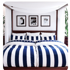
Southampton Bädset 2 delar