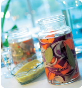
Sex sorters sill ca 1600 g