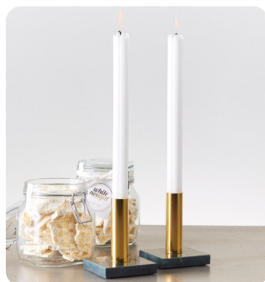
Ljusstakar i marmor 2 st