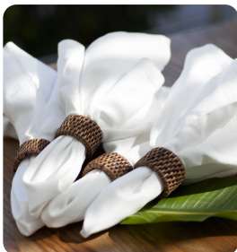
Napkin Rings 4 st