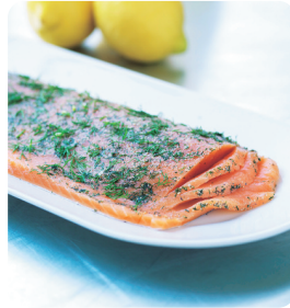
Gravad lax ca 400 g