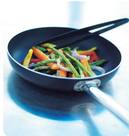
Stekpanna nonstick 28 cm