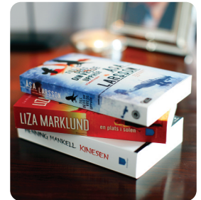
Pocketböcker 3 st