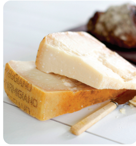
Parmigiano Reggiano ca 500 g